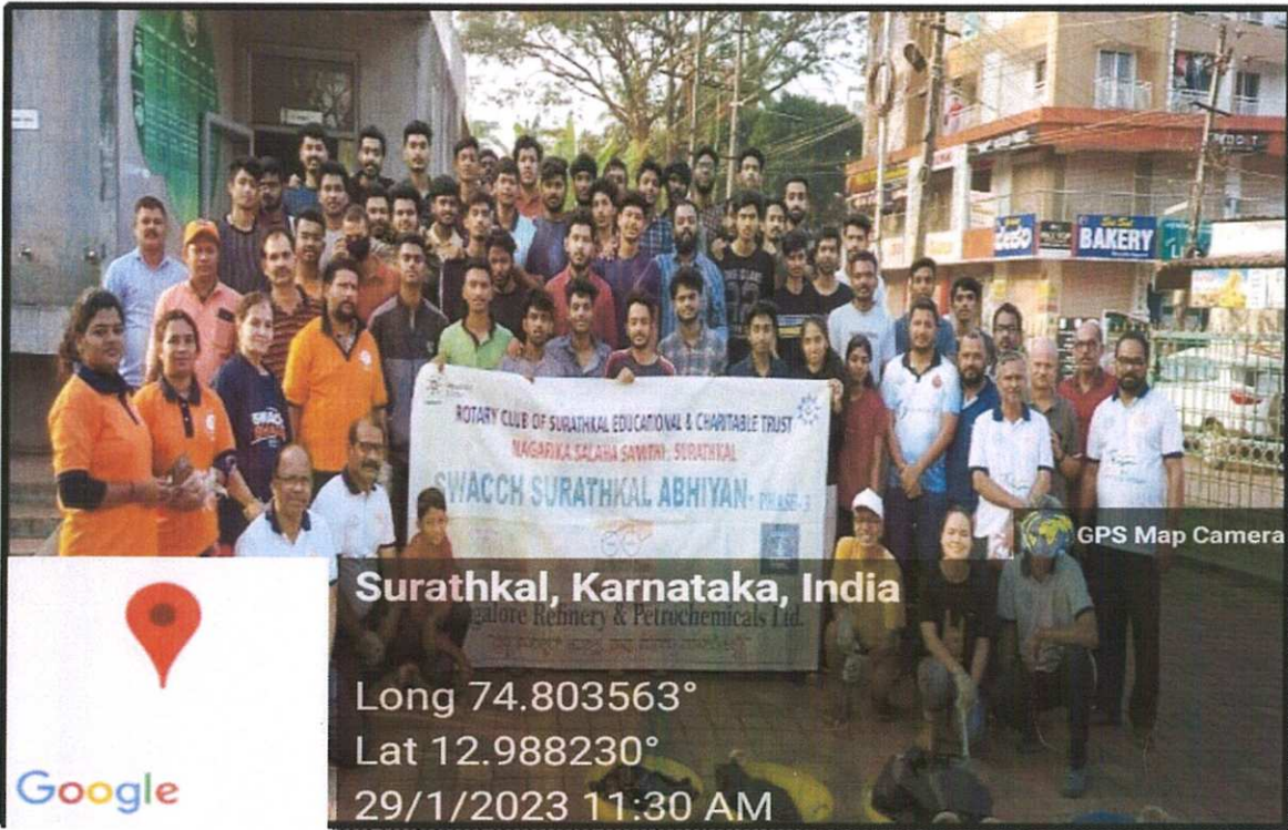
Figure: Group photo during swachhata abhiyan at market road Surathkal.

(Approved by AICTE, New Delhi, Affiliated to Visvesvaraya Technological University, Belgavi)